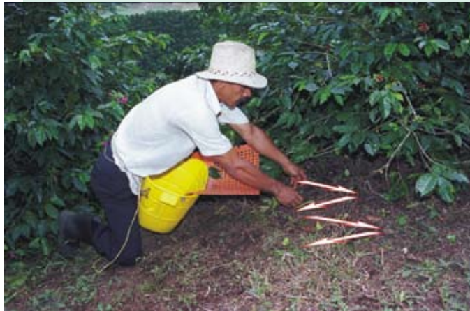
Postura deseable para la recolección de frutos en el estrato bajo y para recoger los frutos del suelo

recomienda tomar la postura de rodillas adelantado una pierna con el fin de adquirir mayor estabilidad al momento de soportar el peso del cuerpo y del recipiente con frutos.