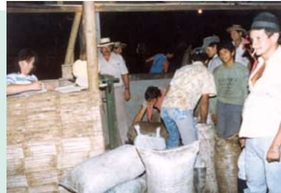
Almacenamiento del café recolectado antes del beneficio

Reciba y despulpe el café el mismo día de la recolección. En los países de máxima cosecha reciba parte del café a medio día, y el resto por la tarde para que puedan hacerse dos despulpadas y no haya acose.