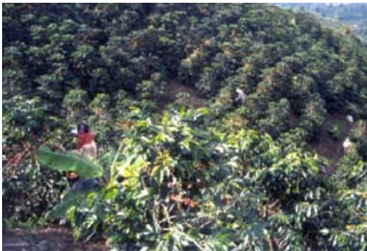
Recolección en el cafetal

Hasta el momento de la cosecha el caficultor ha invertido recursos para alcanzar una alta productividad y una buena calidad del grano en la finca. Por tanto, la recolección debe planearse y ejecutarse siguiendo estas recomendaciones: