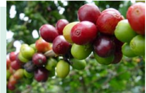
Rama con frutos verdes y maduros