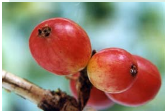
Frutos maduros perforados por broca

Para evitar que la broca se disemine en toda la finca se recomienda que: