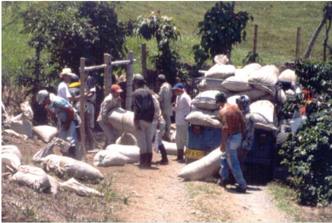
Transporte de café

El traslado del café recolectado desde el lote hasta el lugar de almacenamiento se realiza caminando o en vehículo.