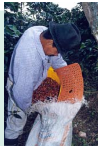
Vaciado del café

Durante el vaciado del recipiente o “coco” y la preparación de costales, es necesario limpiar el café retirando las hojas, amarrar los costales en el extremo libre y agruparlos para pesarlos.