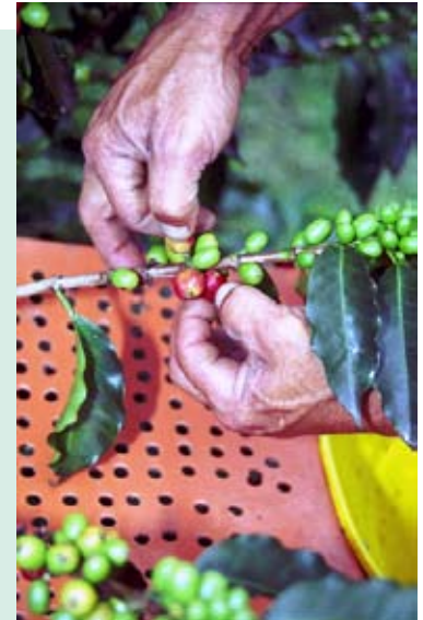
Forma recolectar los frutos en el Método Mejorado