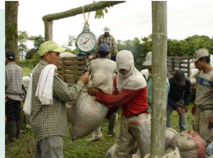
Pesaje preliminar en el lote