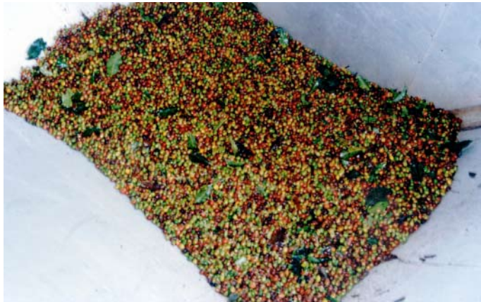
Recolección inadecuada: frutos en diferentes estados de maduración

Cuando recolecta frutos verdes y secos afecta la calidad del café cosechado y la calidad de la bebida. Más de 2,5% de frutos verdes producen grano vinagre, inmaduro y negro.