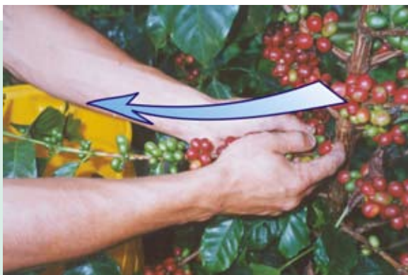
Sentido del desplazamiento de las manos en las ramas