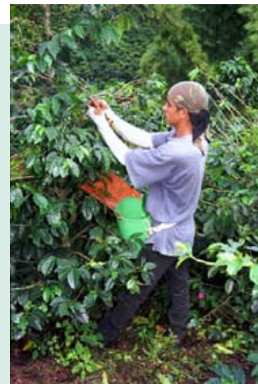
Postura deseable para recolectar café en los estratos alto y medio del árbol

Para recolectar los frutos ubicados en el estrato bajo del árbol y en el suelo, se