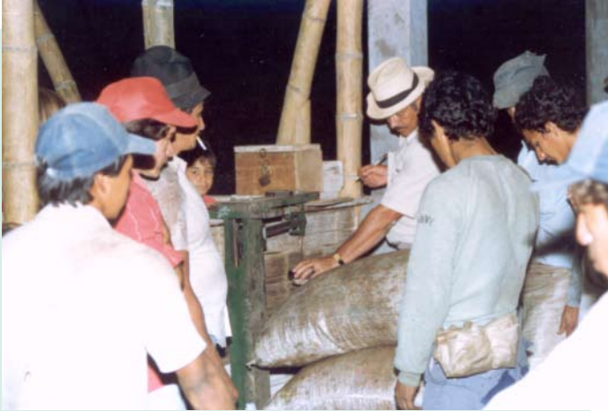
Pesaje en báscula. Fila de recolectores al final de la jornada

Durante esta labor es indispensable que evalúe la calidad del café cosechado, para saber cuánto le debe pagar a cada recolector