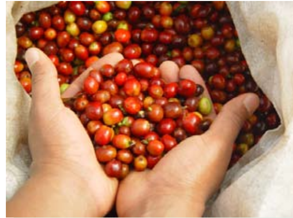
Recolección adecuada: sólo frutos maduros

Los frutos verdes o pintones con menos de 30 semanas o frutos sobremaduros y casi secos de 34 a 36 semanas no tienen un peso adecuado para su recolección, y si los recolecta necesitará mayor cantidad de café cereza para obtener un kilogramo de café pergamino seco.