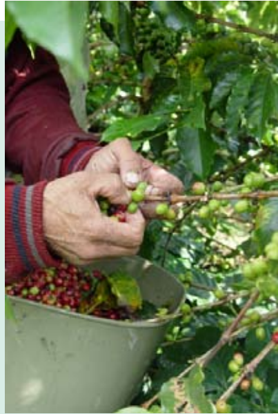
Recolección de frutos maduros

Recolecte solamente y en forma oportuna frutos maduros, haciendo los pases necesarios para evitar que los frutos queden en la planta y se conviertan en hospedantes de la broca.