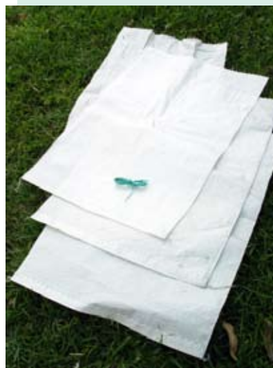
Costales y fibra