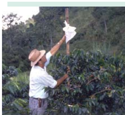
Identificación de lotes con mayor infestación