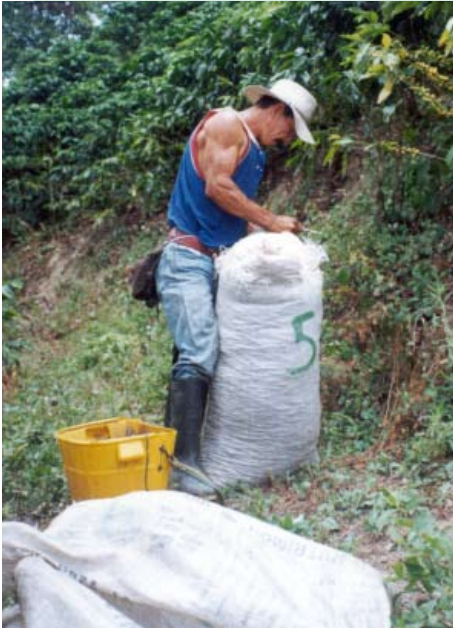
Recolector empacando y cosiendo los costales